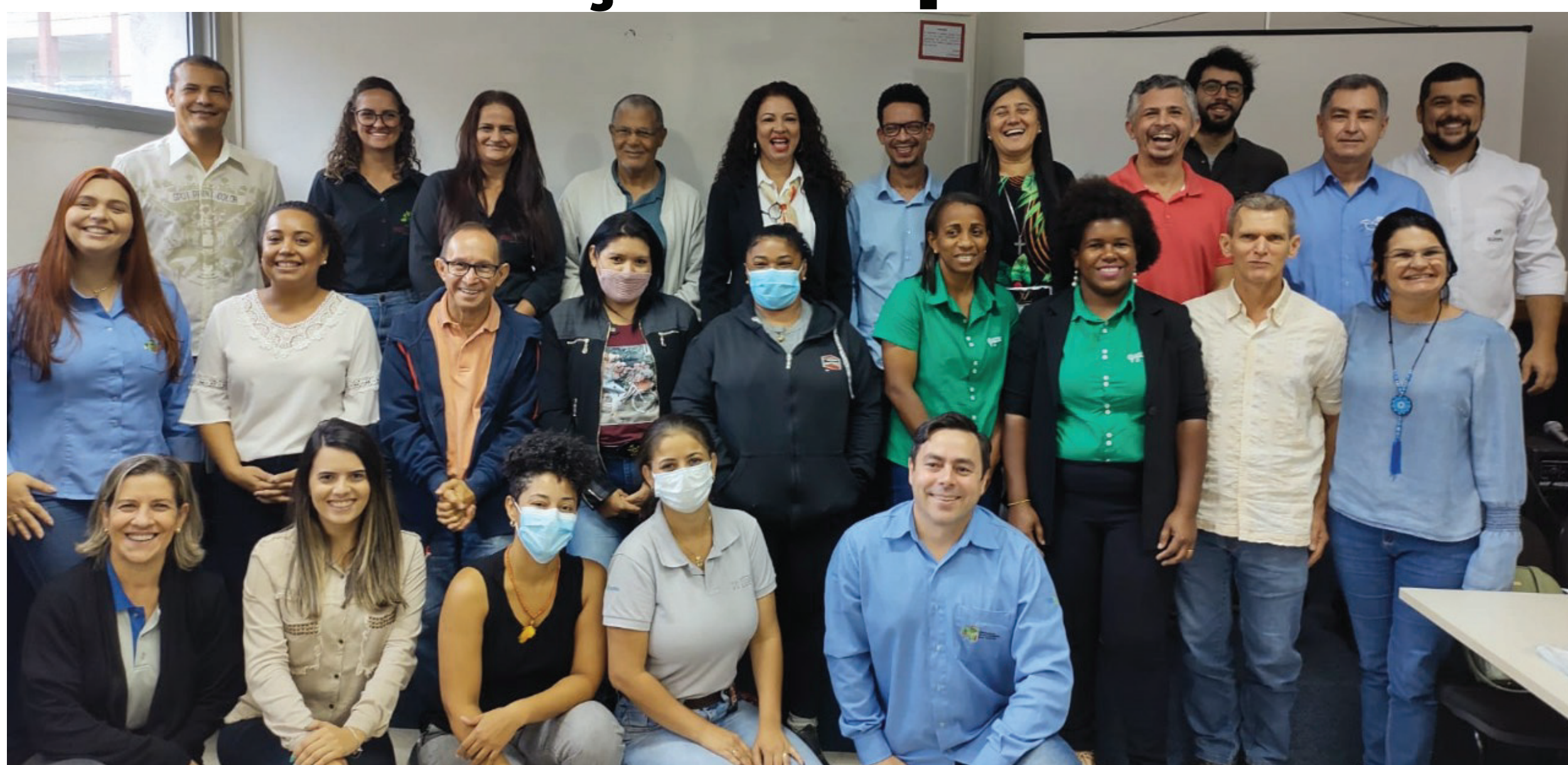
Representantes do CEDAGRO, SUZANO e outras 12 instituições