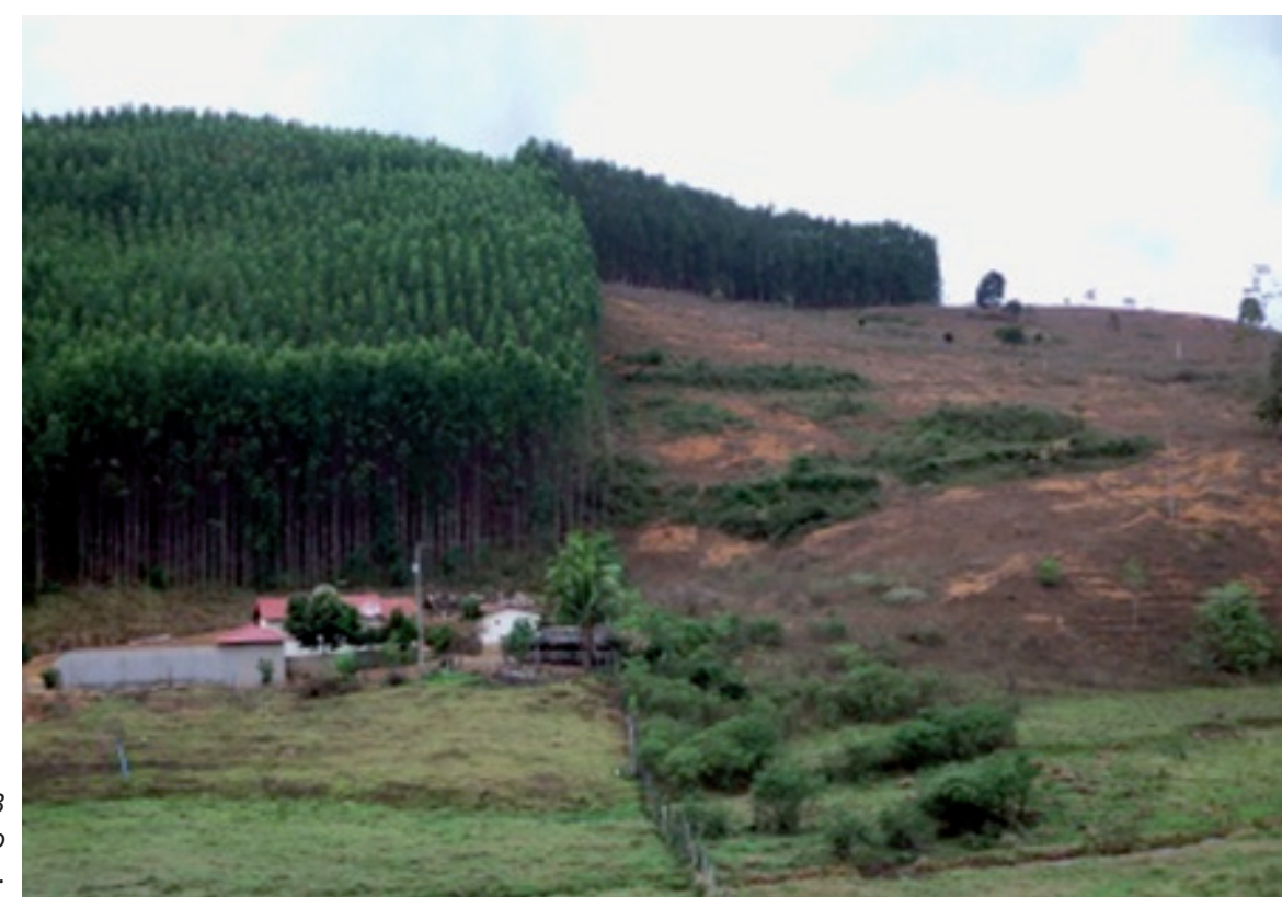
Figura 3 Desenvolvimento do eucalipto em áreas de pasto degradado na Microrregião Centro Oeste do Espírito Santo.